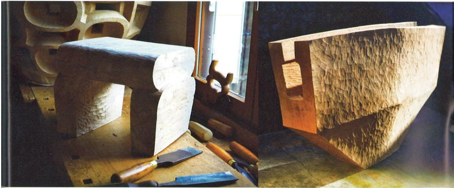
De gauche à droite : Poplar Stool , banc en peuplier, 27 x 32 x 30 cm, 2010 ; Tall Flat Groove , urne en chêne, 51 x 75 x 23 cm, 2011.

cher, ni polluant, facile à travailler, j'élaborais des formes ultra-compliquées, je traçais des plans pour tout. Chaque pièce prenait six mois. J'étais très rigide. » Et pas vraiment verni : dans son atelier, ancienne boulangerie aussi sombre qu'humide, les vapeurs de kérosène peinent à s'enfuir par le soupirail et les souris dansent sur son lit. Pas assez pour effrayer la douce France, qui embrasse dès 1973 le regard hanté, l'art à fleur de peau, le way of life et l'immense érudition de son bel Anglais. Dès la première exposition – « C'était quand, France ? En 1976 ? » – à Piccadilly Gallery, elle sillonne Londres pour contacter la presse et d'autres galeries. Ils traverseront plusieurs phases. Celle des enchevêtrements de poirier ou de chêne assemblés avec force queues d'aronde s'achève, après treize ans, par l'amorce des premières urnes. Gravure sur bois et peinture prennent alors le relais pour une longue période, à laquelle on doit ces autoportraits expressionnistes puissants, inquiétants. Entre-temps, le couple pose ses bagages en France. Se dépouillant peu à peu du superflu, par choix. « La camionnette, trop polluant. La télé, pas question. Julian a même retiré le réfrigérateur... Ça n'a pas duré longtemps. Il est fou ! », s'esclaffe France.